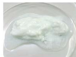
牛乳+乳酸菌 +スピルリナ原末100%